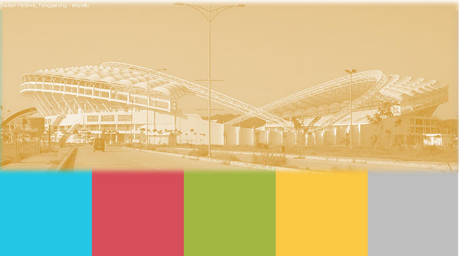
Stadion Perjiwa, Tenggarong - ampelo